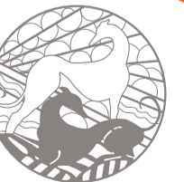
Un portail monumental, aujourd'hui démolé, signalait le cynodrome.

Malheureusement, la société ne reçut pas l'autorisation du Pari mutuel, l'organisme qui autorise les courses en France. Le cynodrome fut alors reconverti en parc des sports dès 1930.